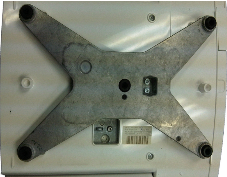
Typical subplatter and sealing for the KH 100-#, KH 200-# and KH 800-# models / Sous-plateau et scellage typique pour les modèles KH 100-#, KH-200-# et KH 800-#