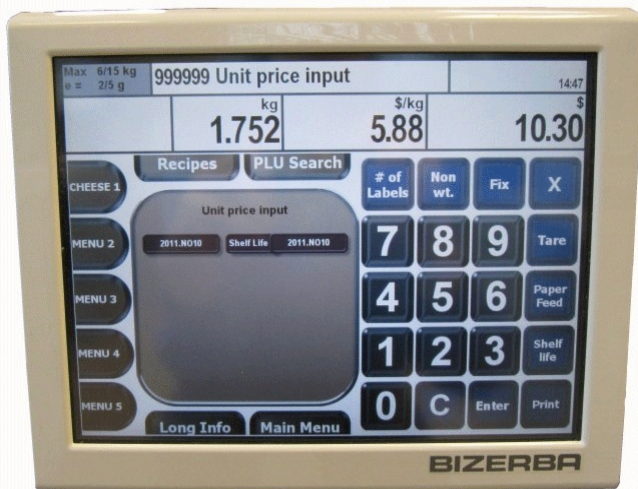
Typical display of model K 100 G / Affichage typique du modèle K 100 G