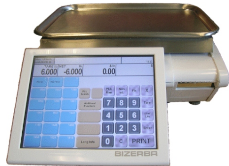
Typical KH 100-# model with fish platter / Modèle KH 100-# typique avec plateau pour poissons