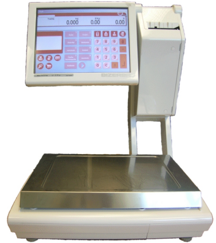
Typical KH 800-# model / Modèle KH 800-# typique