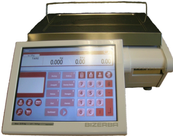
Typical KH 100-# model / Modèle KH 100-# typique