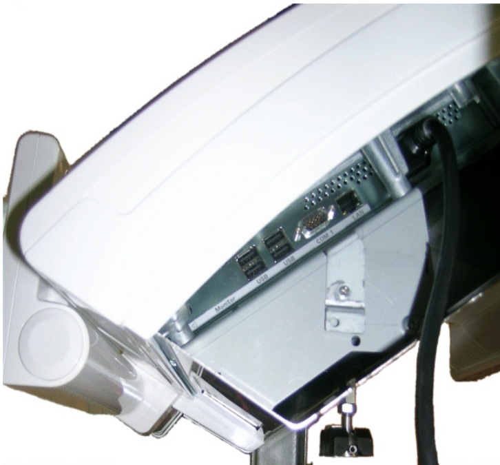
Typical sealing for model KH 400-# / Scellage typique pour le modèle KH 400-#