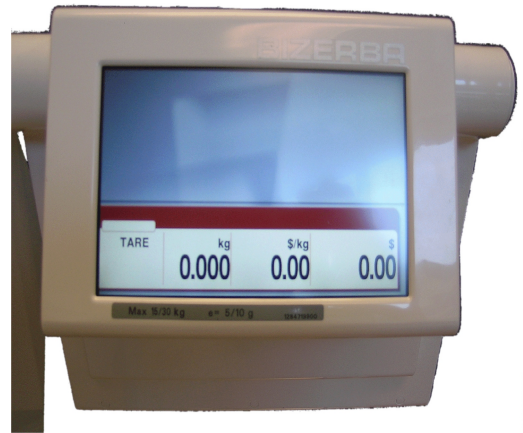
Typical customer display for KH series / Affichage typique destiné au client pour la série KH