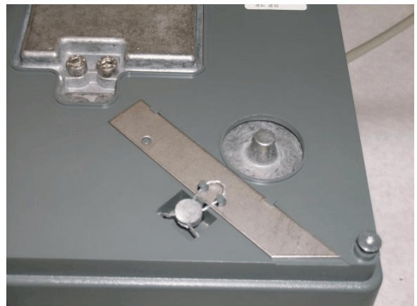
Typical sealing of calibration switch and housing of model K 100 G / Scellage typique du commutateur et du boîtier de calibration du modèle K 100 G