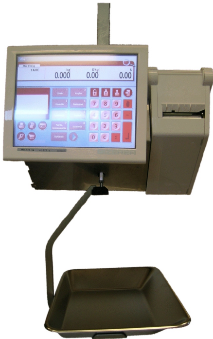
Typical KH 400-# model / Modèle KH 400-# typique