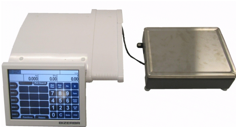
Typical model K 100 G / Modèle typique K 100 G