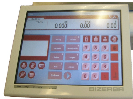
Typical operator display for KH series / Affichage typique destiné à l'opérateur pour la série KH