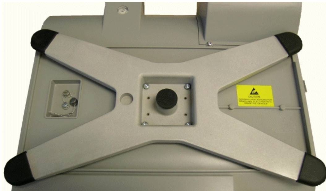
Typical sub-platter and sealing / Sous plateau et scellage typique