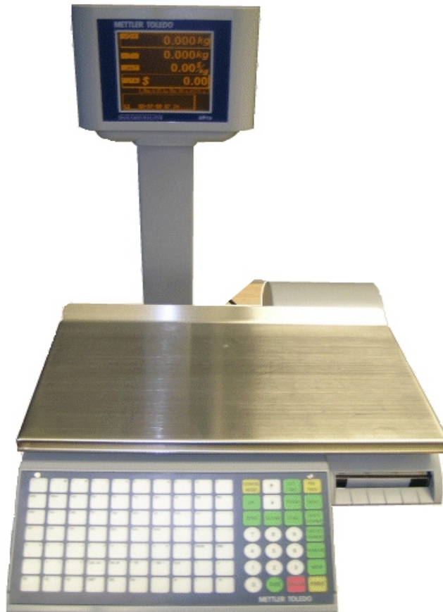
Typical model bPro / Modèle typique bPro