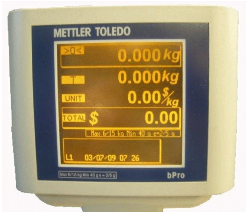
Typical display / Affichage typique