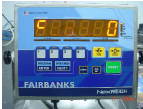
Typical FB5050/FB5050-K model / Modèle FB5050/FB5050-K typique