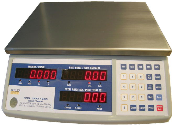
Typical model KRS 1000-1530/ Modèle typique KRS 1000-1530