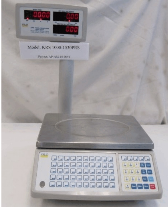
Typical model KRS 1000-1530 PRS/ Modèle typique KRS 1000-1530PRS