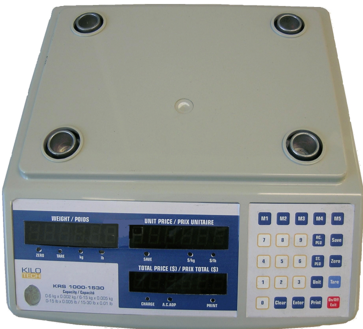
Typical sub-platter / Sous-plateau typique