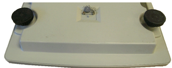
Method of sealing / Méthode de scellage