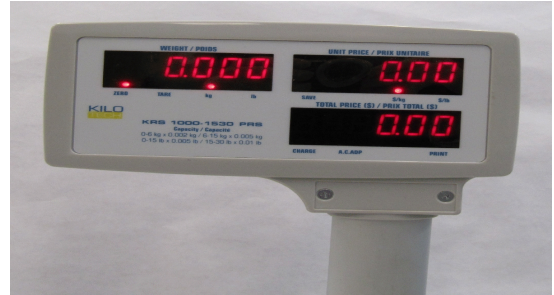
Typical operator's display for models KRS 1000-1530PRS / L'affichage typique destiné à l'opérateur du modèle KRS 1000-1530PRS