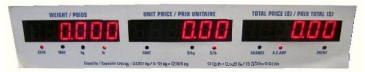
Typical customer's display / L'affichage typique destiné aux clients