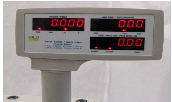
Typical customer's display for model KRS 1000-1530PRS/ L'affichage typique destiné aux clients du modèle KRS 1000-1530PRS