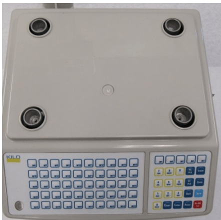
Typical sub-platter for model KRS 1000-1530PRS/ Sous-plateau typique du modèle KRS 1000-1530PRS