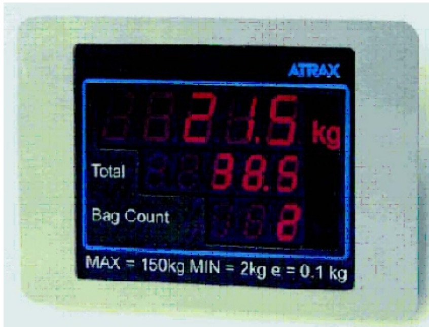
Customer display / Affiche destiné aux clients