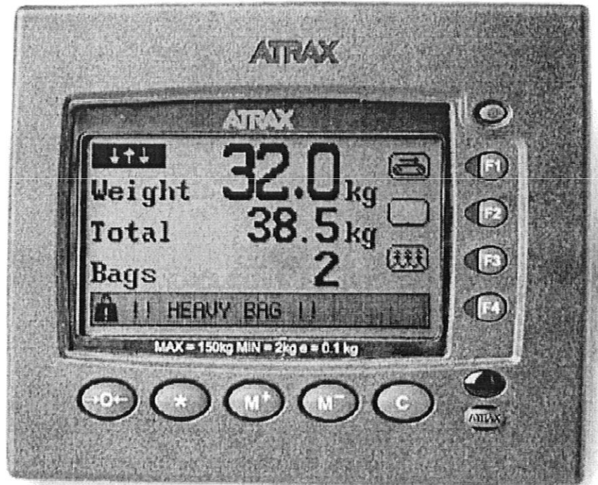
Operator's display and keypad / Affichage et touches destiné à l'opérateur