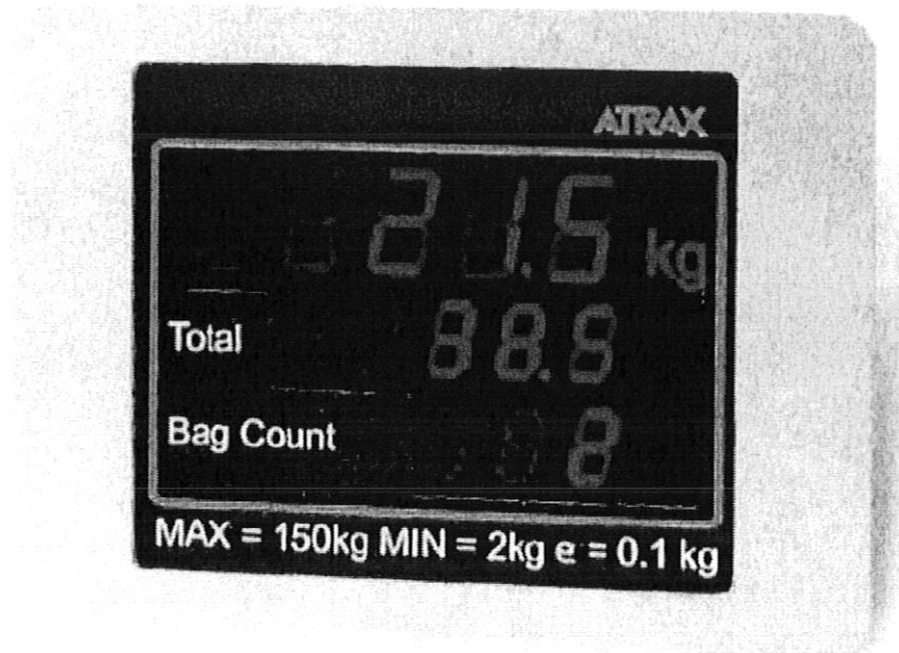
Customer display / Affiche destiné aux clients