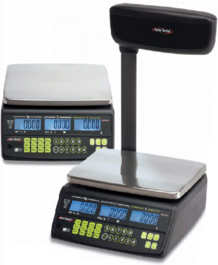
Model FX50 / Modèle FX50