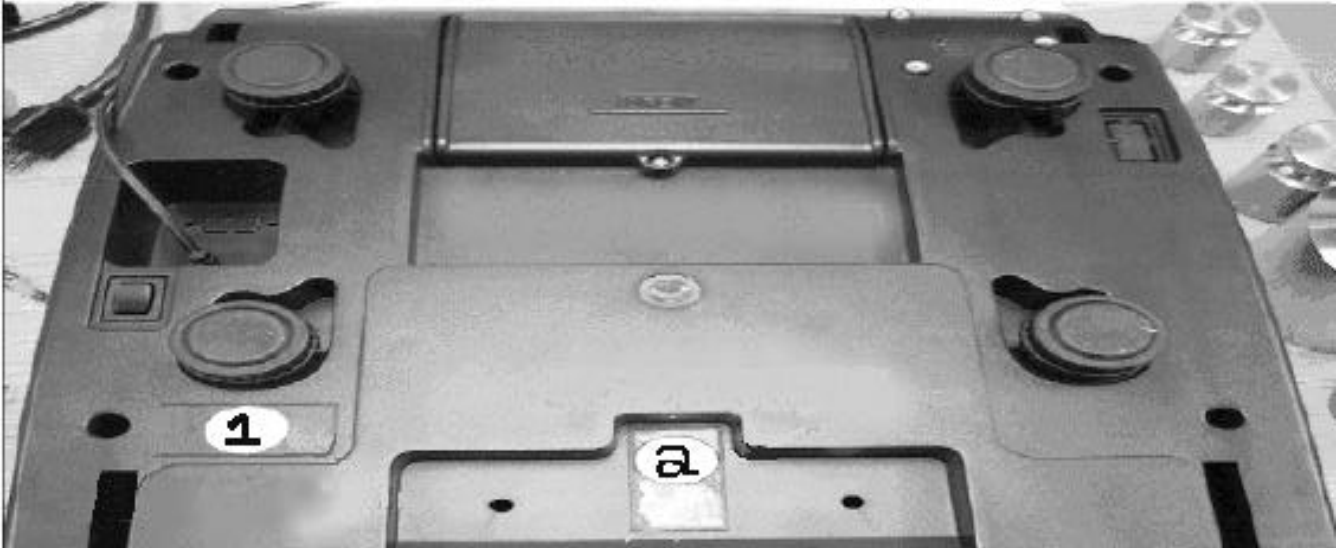
Sealing method / Méthode de scellage