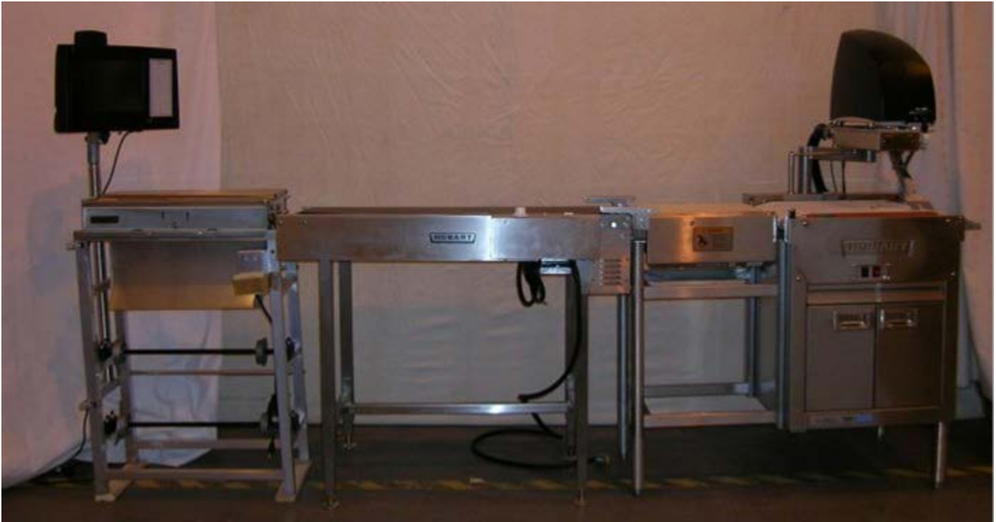
Typical Model EPSA-C + EPCP-# or CLAS-* + EPCP-# / Modèle EPSA-C + EPCP-# or CLAS-* + EPCP-# typique