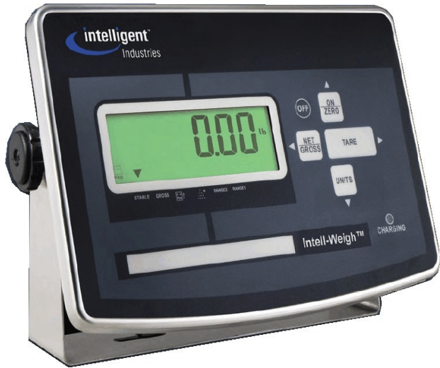
Typical model Intel-Weigh / Modèle typique Intel-Weigh