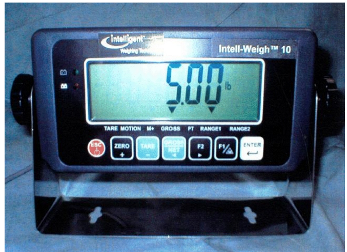
Typical Model Intel-Weigh 10/ Modèle typique Intel-Weigh 10