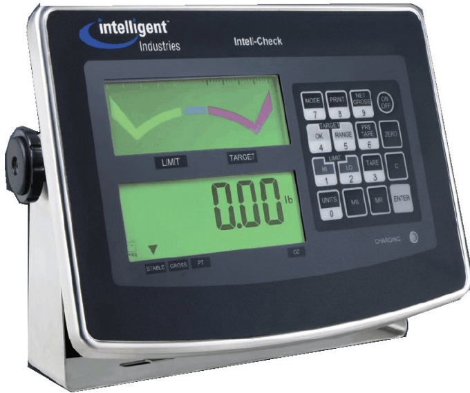
Typical model Intel-Check/ Modèle typique Intel-Check