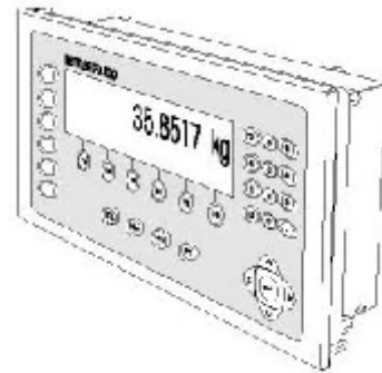
Typical Model IND690 Wall Mounted Unit/ Modèle typique IND690 pour fixer au mur