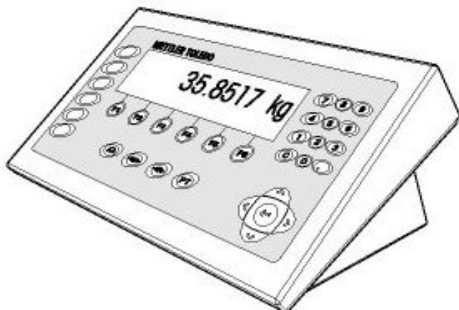
Typical Model IND690 Desk Unit/ Modèle typique IND690 de table