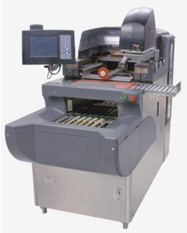
Typical models AWS-* + EPCP-#, EWS-* + EPCP-# / Modèles AWS-* + EPCP-#, AWS-* + EPCP-# typique