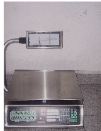
Model / modèle **40LT-X