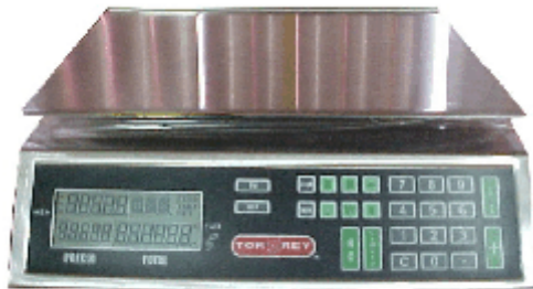
Model / modèle MFQ-40L-X