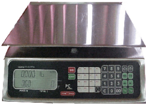
Model / modèle PC-40L-X