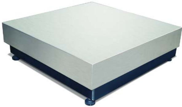
Typical Model HD / Modèle typique HD