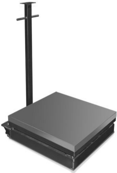
Typical Model HDP (4-wheel) / Modèle typique HDP (4 roues)