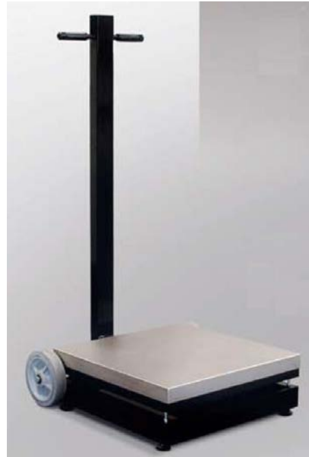
Typical Model HDP (2-wheel) / Modèle typique HDP (2 roues)