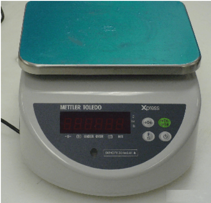
Typical Operator's Display / L'affichage typique de l'opérateur