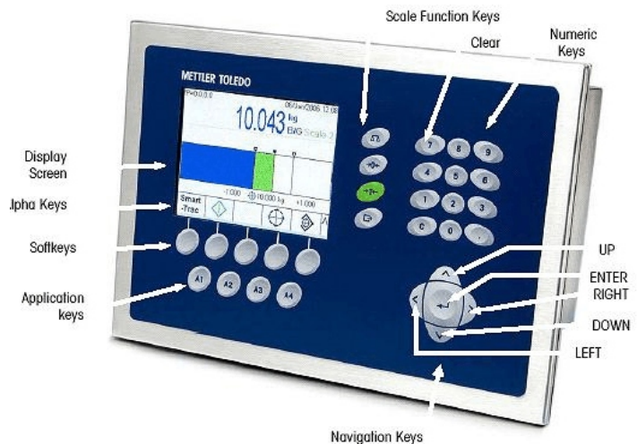
Typical IND780 Indicator / Indicateur IND780 typique