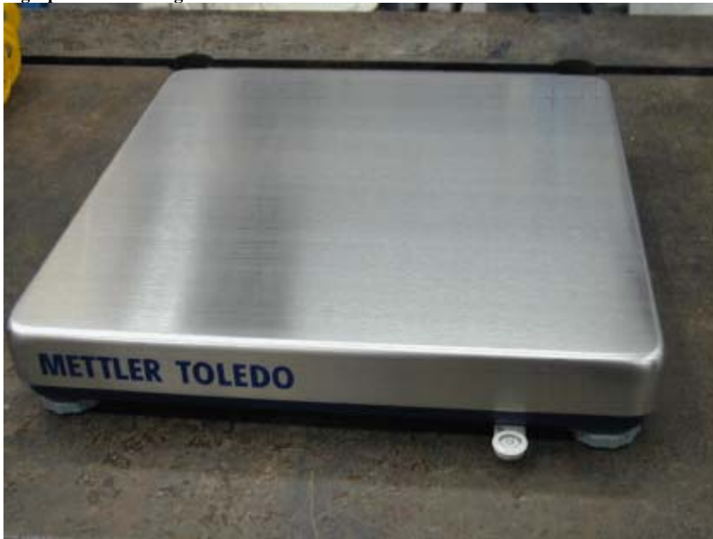
Typical model / Modèle typique