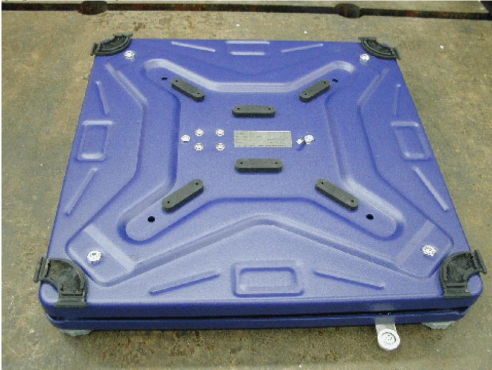
Typical model CB 6*, CB 15*, CB 30*, CB 60*, CB 60L*, CB 150*, CBU 6*, PBA655 6*, CBU 15*, PBA655 15*, CBU 30*, PBA655 30*, CBU 60*, PBA655 60*, CBU 60L*, PBA655 60L*, CBU 150* and PBA655 150* without platter / Modèle CB 6*, CB 15*, CB 30*, CB 60*, CB 60L*, CB 150*, CBU 6*, PBA655 6*, CBU 15*, PBA655 15*, CBU 30*, PBA655 30*, CBU 60*, PBA655 60*, CBU 60L*, PBA655 60L*, CBU 150* et PBA655 150* typique sans le plateau