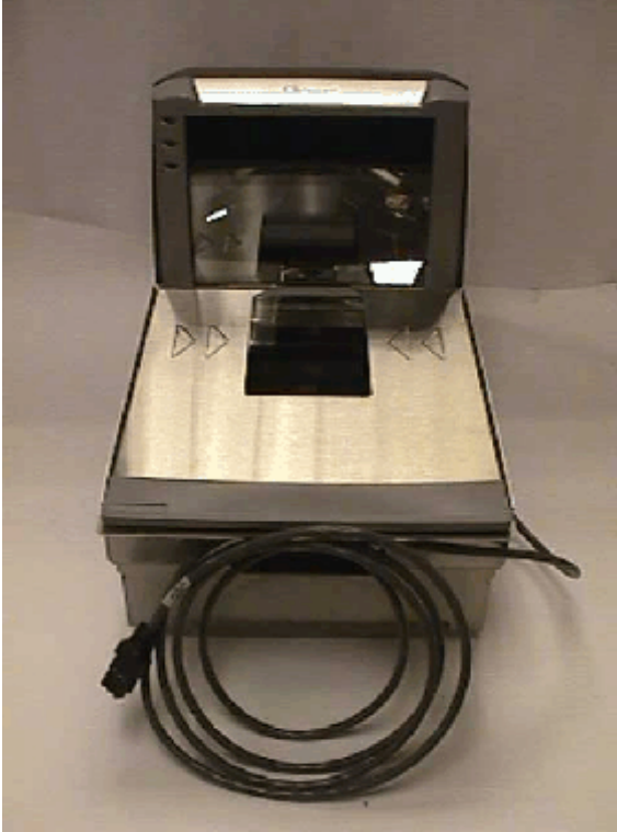
Typical model / Modèle typique