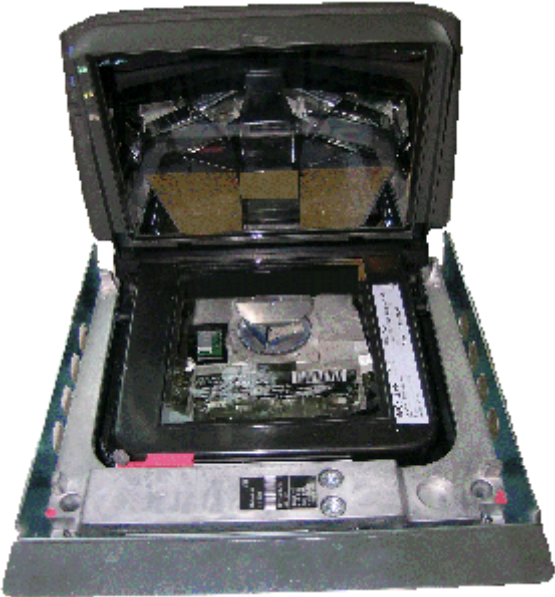
Sub-frame / Sous châssis