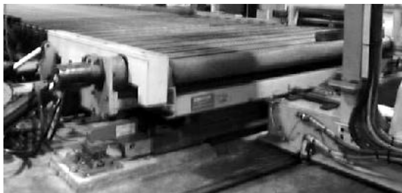
Transportation mode / Mode transport