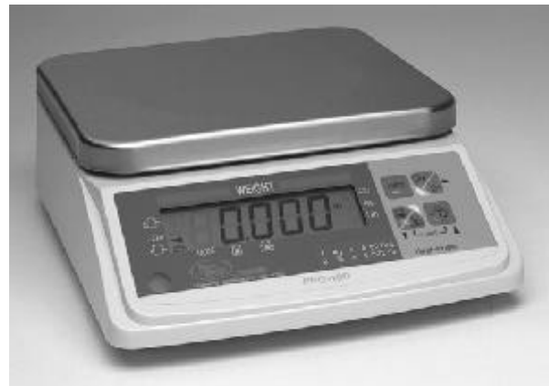
Typical Model / Modèle typique