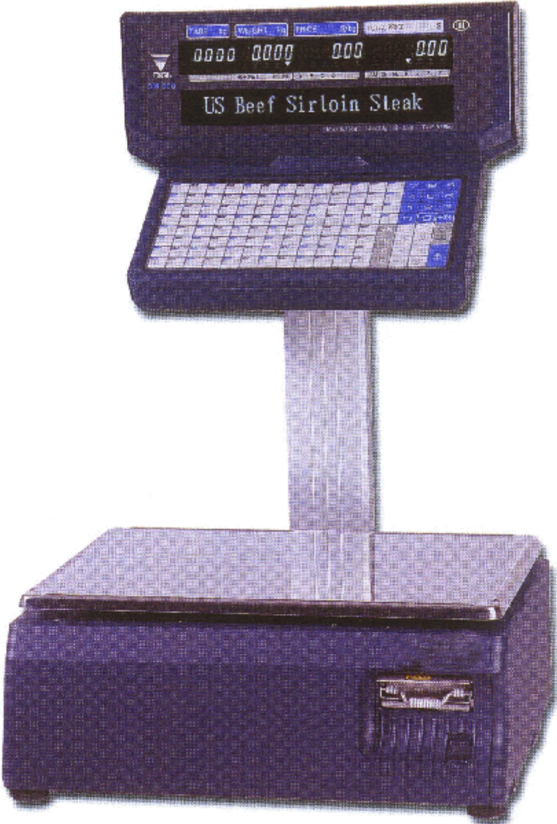
SM-90 II EV