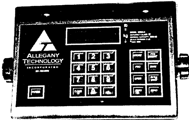
MEGA-8 typical model/ modèle typique