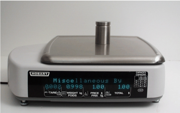
Typical customer display / Affichage client typique