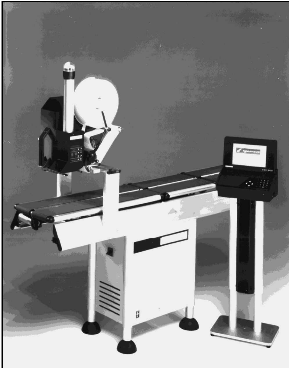
ES 600 HS