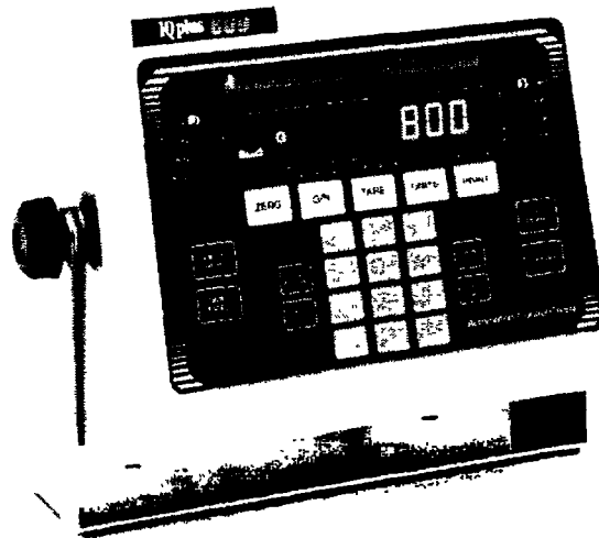
IQ + 800 model / modèle

Michel Létourneau Examineur d'approbations Tél: (613) 952-0663