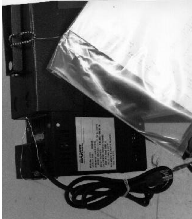
Figure 3: 2250/2251 Electrical Power Supply/Alimentation électrique