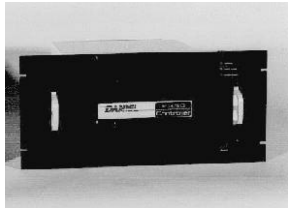
Figures 4-5: 2350 Controller with Keypad and Display (left) and without keypad and display (right) / 2350 contrôleur avec un clavier et un dispositif (à gauche) et sans un clavier et un dispositif (à droite)