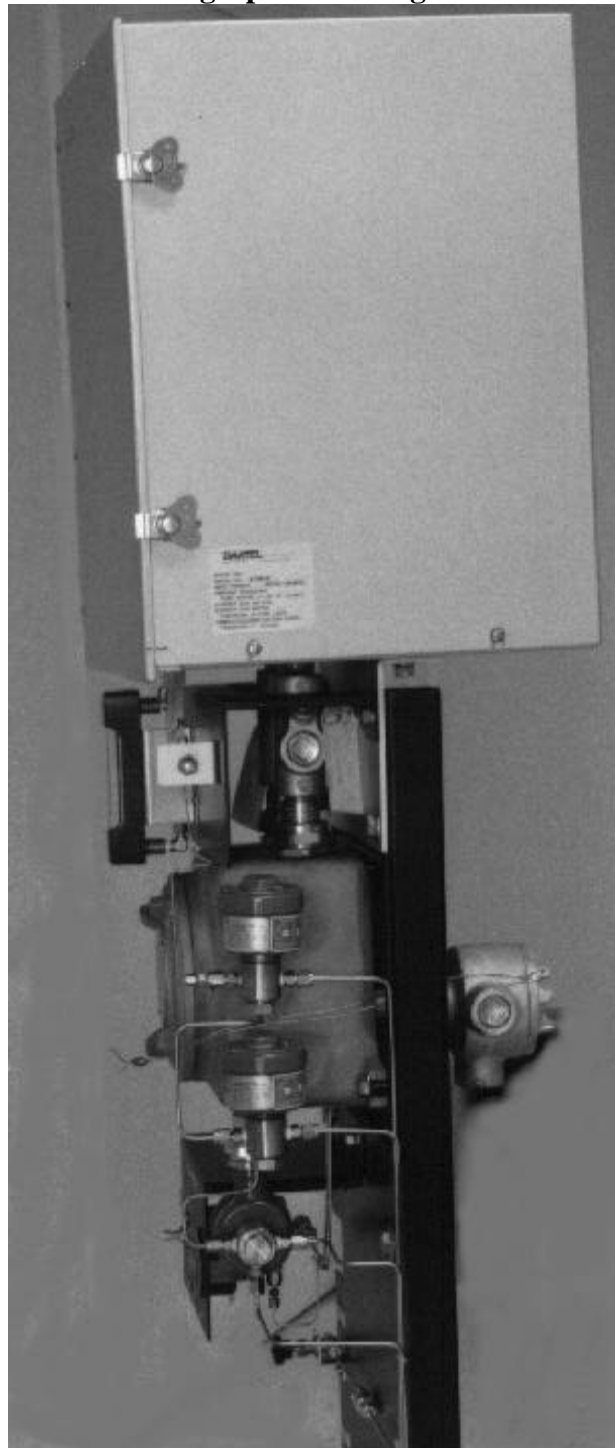
Figure 1: Gas Chromatograph Detector / Détecteur du chromatographe en phase gazeuse