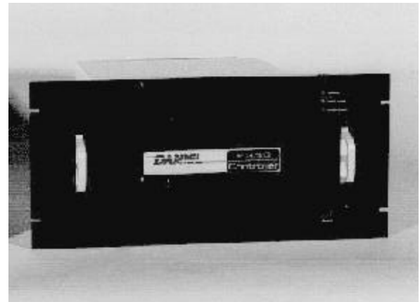
Figures 4-5: 2350 Controller with Keypad and Display (left) and without keypad and display (right) / 2350 contrôleur avec un clavier et un dispositif (à gauche) et sans un clavier et un dispositif (à droite)