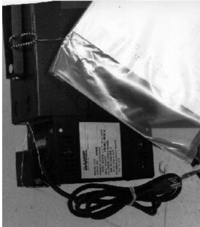
Figure 3: 2250/2251 Electrical Power Supply/Alimentation électrique