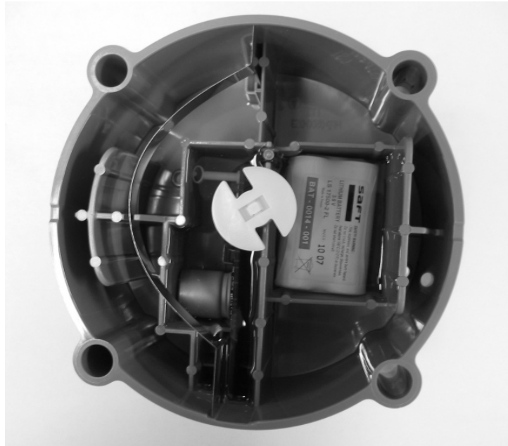
Fig. 1: 100G ERT, Part No. ERG-5000-007 (Front View) / N° de pièce ERG-5000-007 (vue de face)