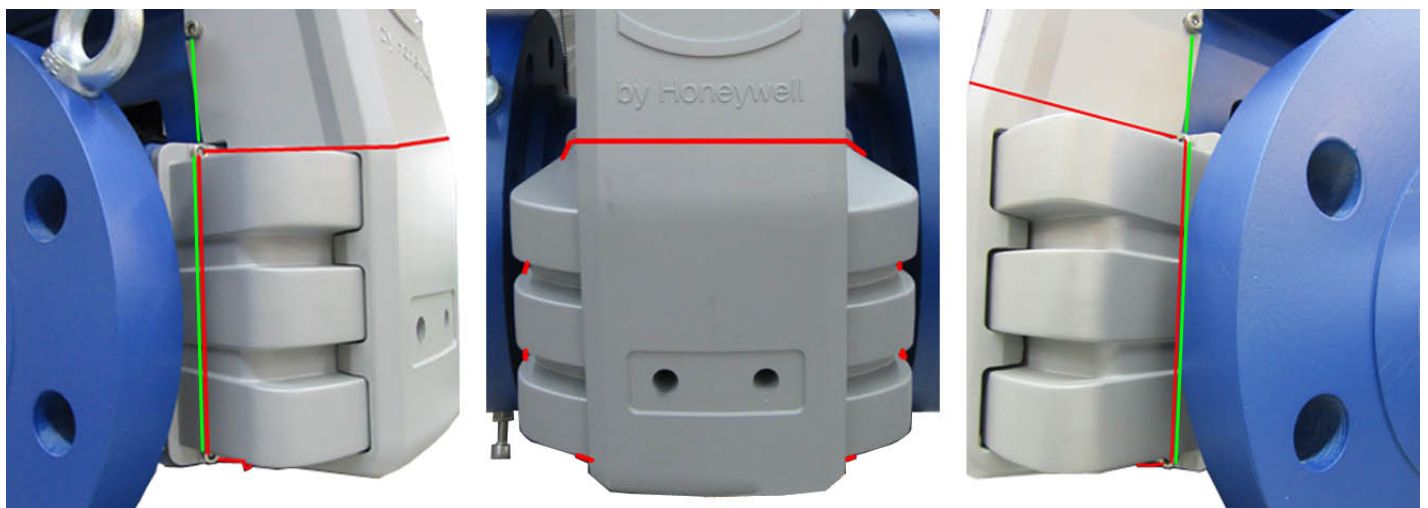
Figure 6. Sealing the transducers on one face of the meter, for meter sizes DN150/6" and smaller, using a single sealing wire (red line) and using two sealing wires (green line) | Scellage des transducteurs sur un côté du compteur pour les compteurs de tailles DN150/6 po et moins, à l'aide d'un fil de scellage (ligne rouge) et de deux fils de scellage (ligne verte).