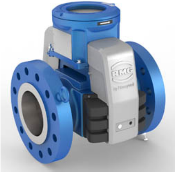
Figure 1 Meter sizes DN150/6" and smaller | Tailles de compteurs DN150/6 po et moins