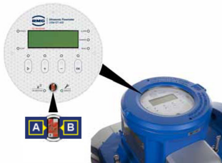
Figure 3. The Calibration Switch (A) in the open (unsealed) position and the Service Switch (B) in the closed (sealed) | Interrupteur d'étalonnage (A) en position ouverte (non scellé) et interrupteur de service (B) en position fermée (scellé)