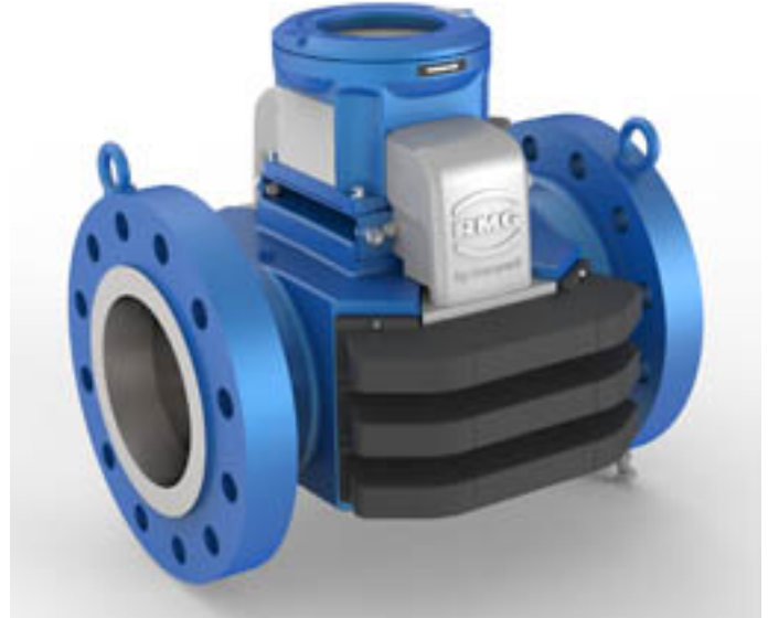
Figure 2 Meter sizes DN200/8" and larger | Tailles de compteurs DN200/8 po et plus