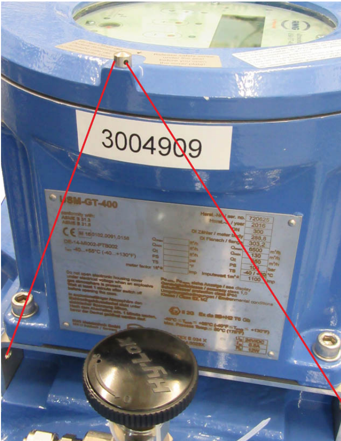
Figure 4 Sealing the electronics head | Scellage des composants électroniques (tête)