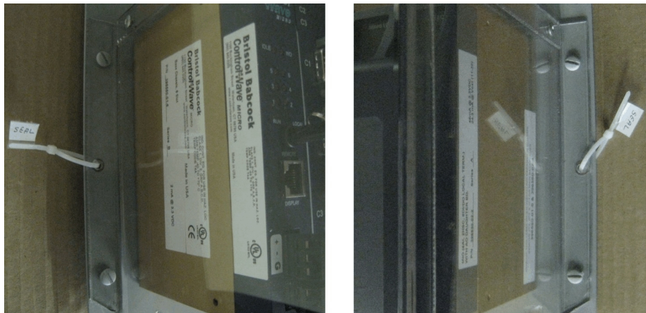
Figure 2 Sealing arrangement showing the seal on both sides of the sealing enclosure / Scellage montrant le sceau des deux côtés du boîtier scellé