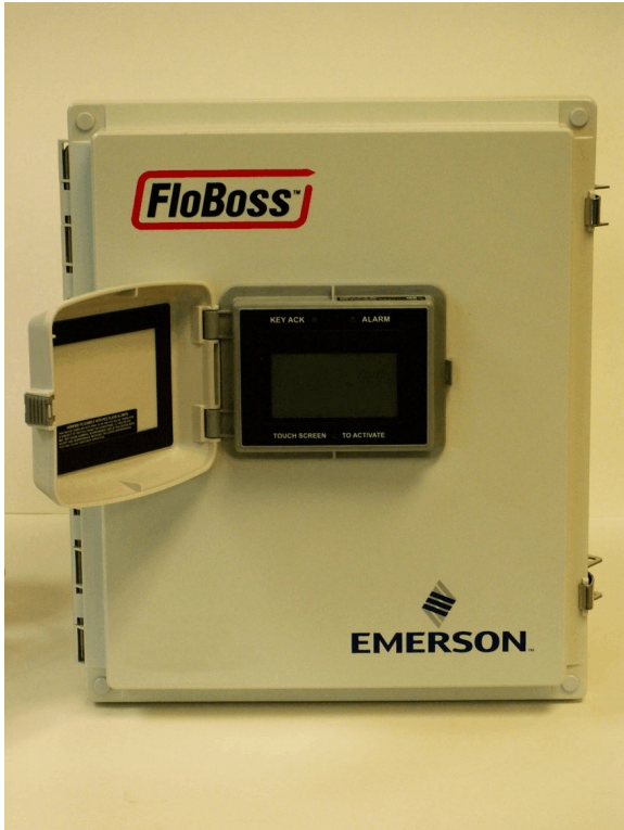
Figure 1 W40184