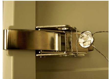
Figure 2 Hasp Sealing / Morillon (scellage)