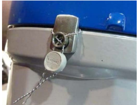
Figure 2: Sealing Figure 2: Scellage