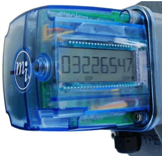
Figure 1. TCI / TCI