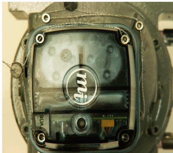
Figure 2. Sealing the TCI to the adapter plate / Scellage de le TCI à la plaque d'adaptation