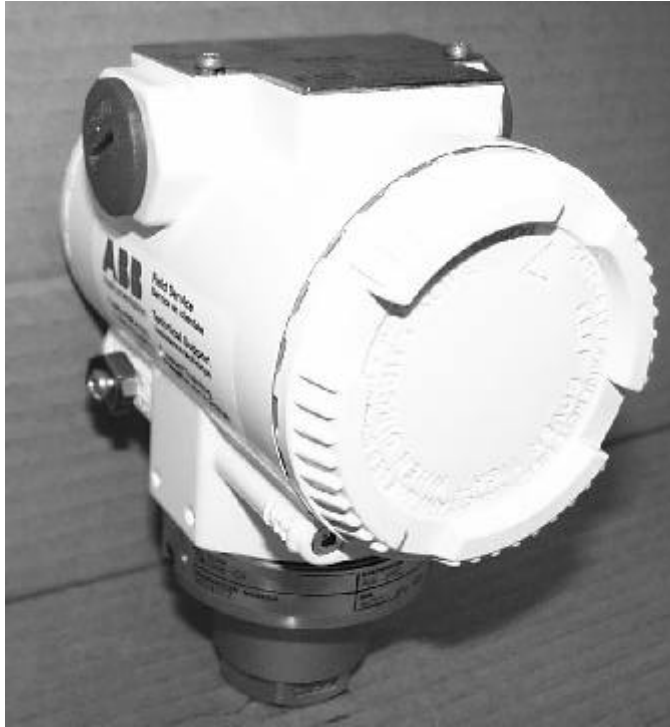
Figure 2 Model 624EG/EA/ Modèle 624EG/EA