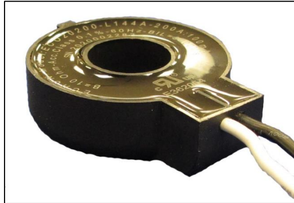
Figure 1 – ECO20200