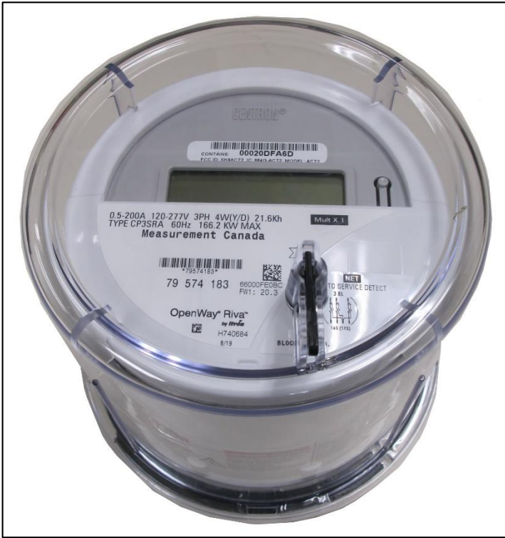
CENTRON II OpenWay Riva Polyphase