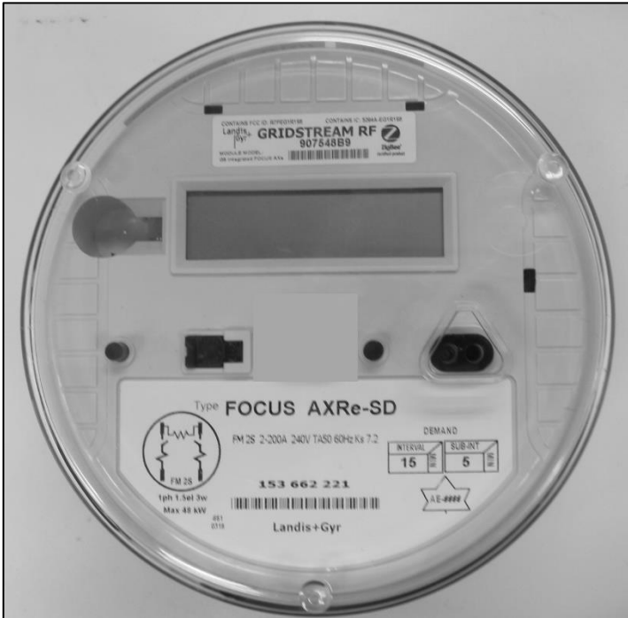
Meter / Compteur