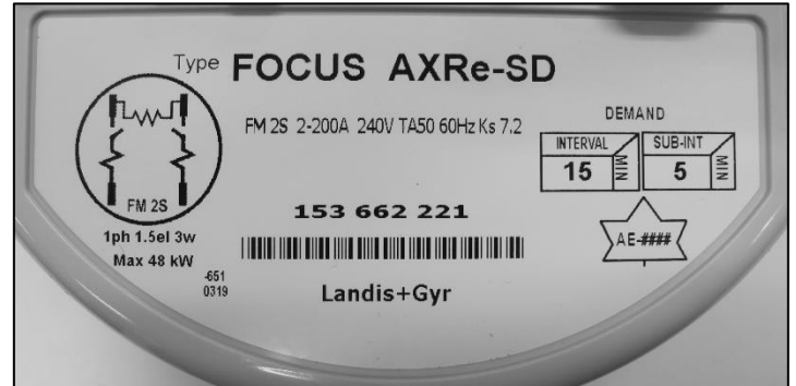
Nameplate / Plaque signalétique