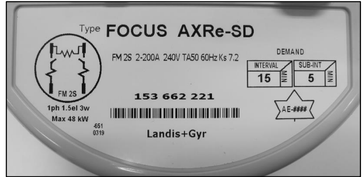
Nameplate / Plaque signalétique