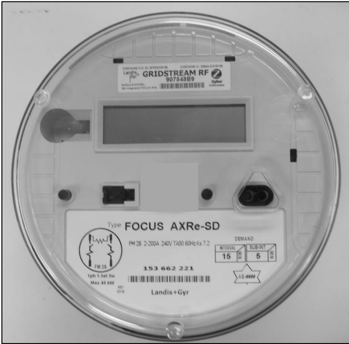
Meter / Compteur