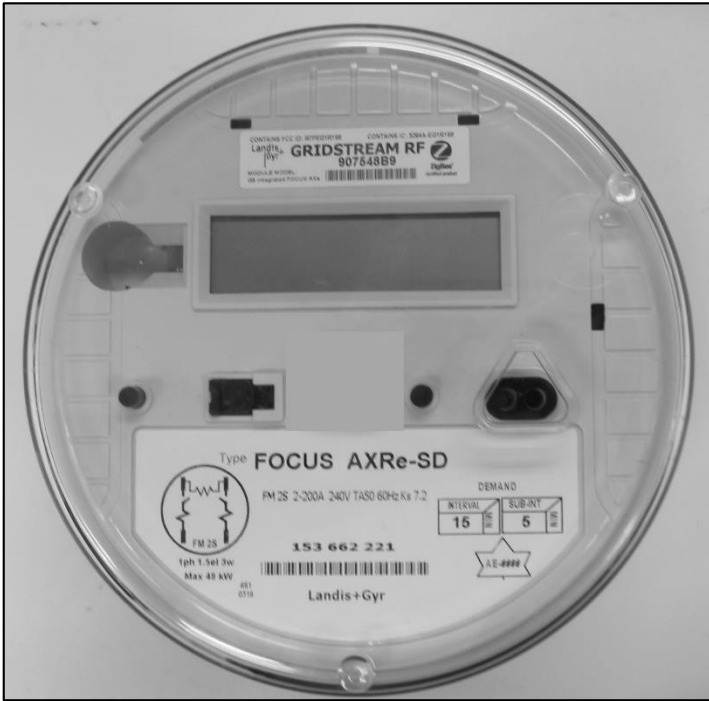
Meter / Compteur