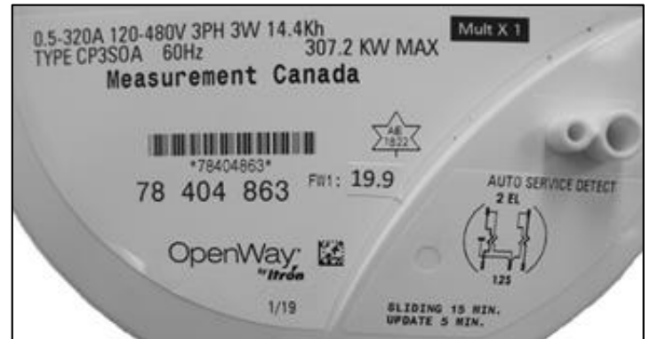
Nameplate / Plaque signalétique