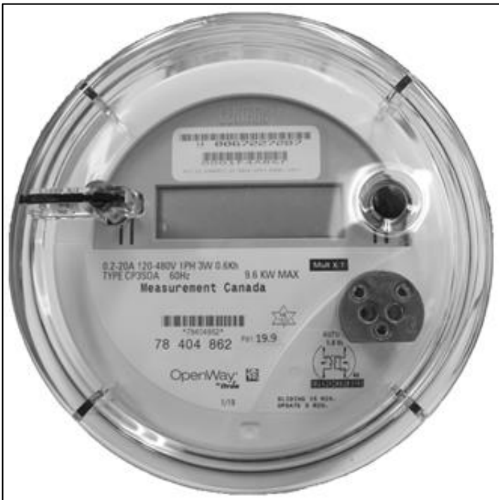
CP3SOA meter / Compteur CP3SOA