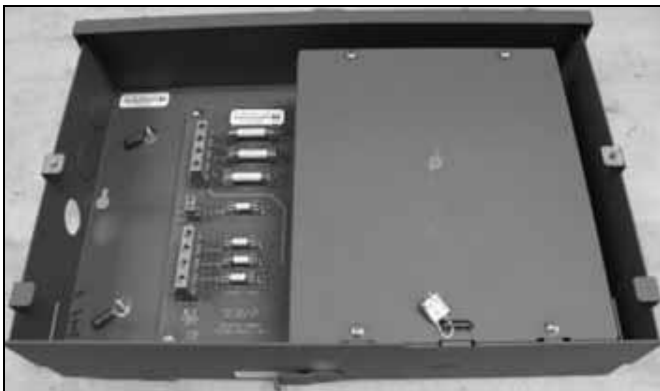
Voltage Transformer Metrological Sealing Location / Emplacement du sceau métrologique du transformateur de tension