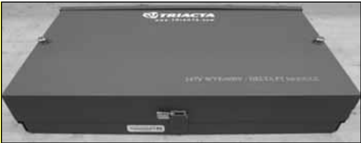
Triacta Voltage Transformer / Transformateur de tension de Triacta