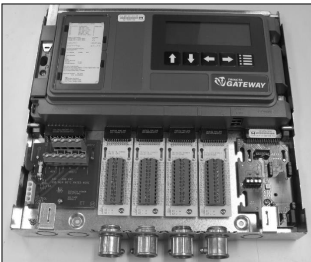
Exposed Terminal Cards / Carte bornes exposée