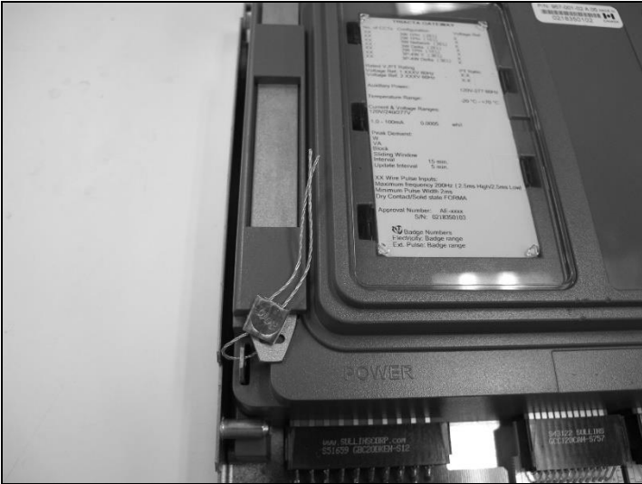
Meter Seal / Sceau du compteur