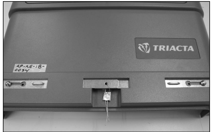
Utility seal used with exposed terminal card / Sceau de service public avec la carte bornes exposée