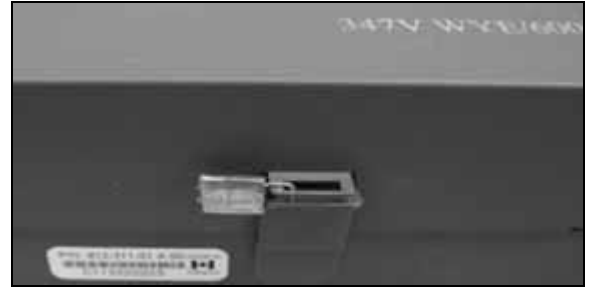
Voltage Transformer Utility Sealing Location / Emplacement du sceau des services publics du transformateur de tension