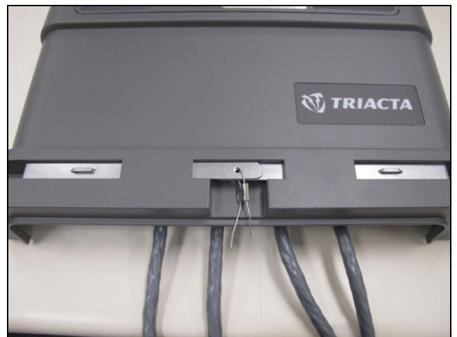
Utility seal used with overmolded terminal card / Sceau de service public avec la carte bornes moulée