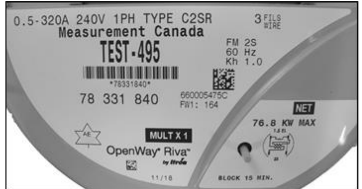
Nameplate / Plaque signalétique