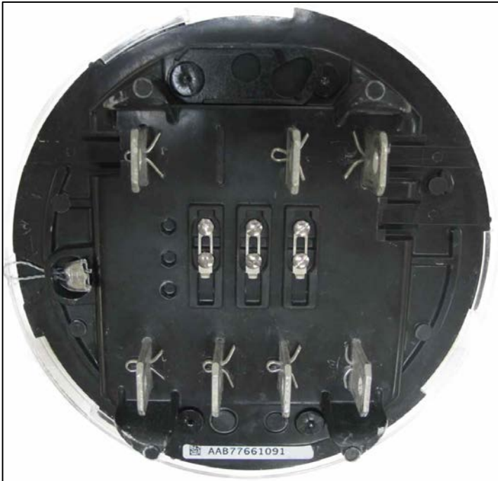
Sealing / Scellage