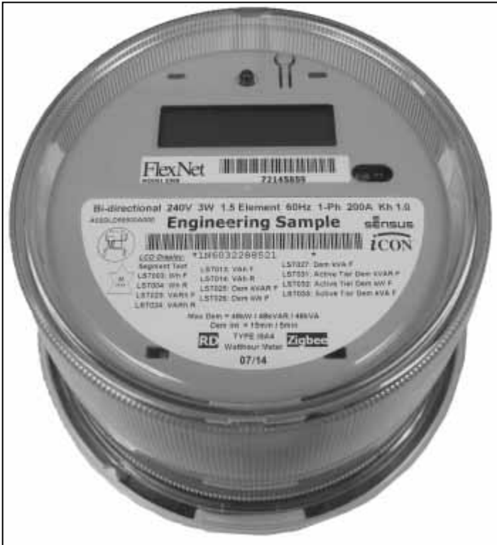
iSA4 Meter / Compteur iSA4