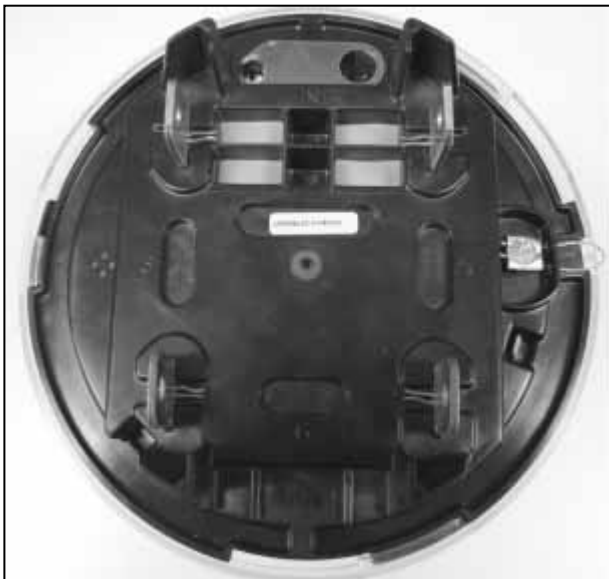
Meter Sealing / Scellage du compteur