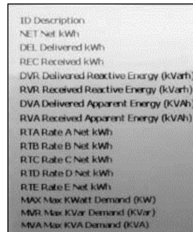
Display Legend for E650 S4x RXR meter / Légende d'affichage pour le compteur E650 S4x RXR