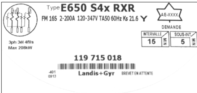
E650 S4x RXR polyphase meter nameplate / Plaque signalétique du compteur polyphasé E650 S4x RXR