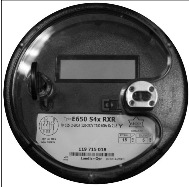
E650 S4x RXR meter front view / Vue de face du compteur E650 S4x RXR