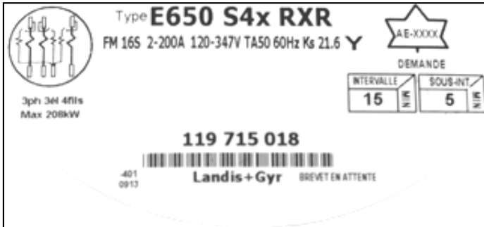
E650 S4x RXR polyphase meter nameplate / Plaque signalétique du compteur polyphasé E650 S4x RXR