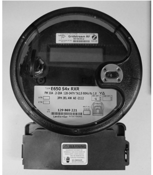
Bottom connected meter / Compteur de socle à connexion par le bas