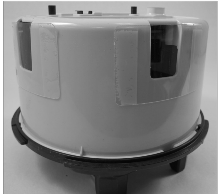
Polycarbonate shields placed over the three meter housing access holes / Boucliers en polycarbonate placés sur les trois trous d'accès du boîtier du compteur