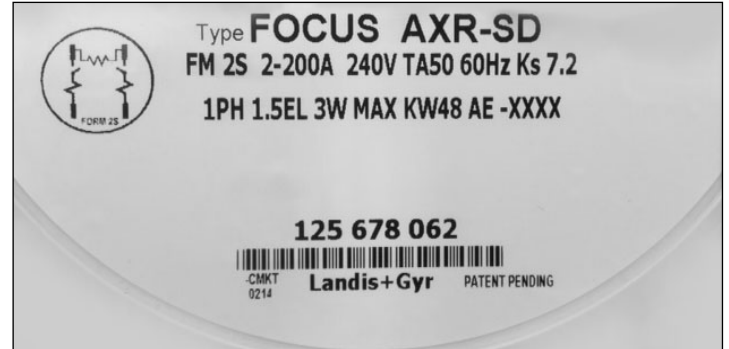
FOCUS AXR-SD Meter Nameplate / Plaque signalétique du compteur FOCUS AXR-SD