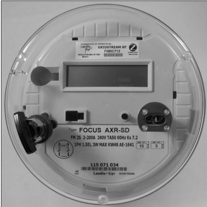
FOCUS AXR-SD Front View / Vue de face FOCUS AXR-SD