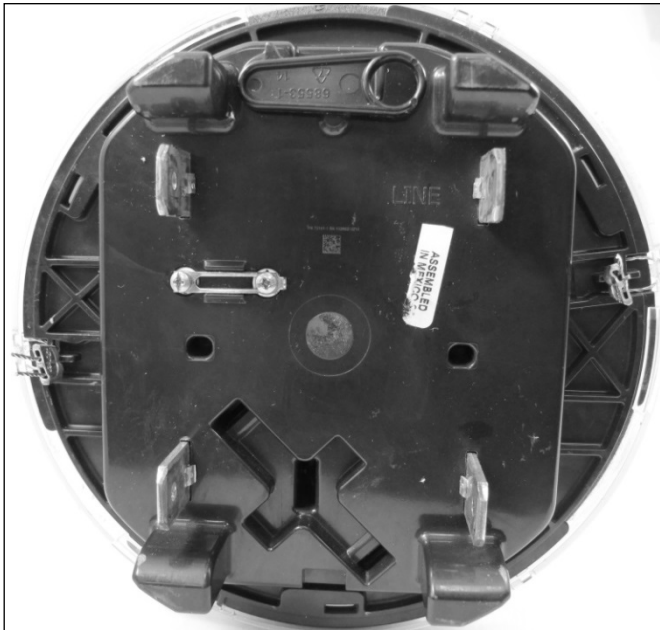
FOCUS AXR-SD sealing points / Points de scellage du FOCUS AXR-SD