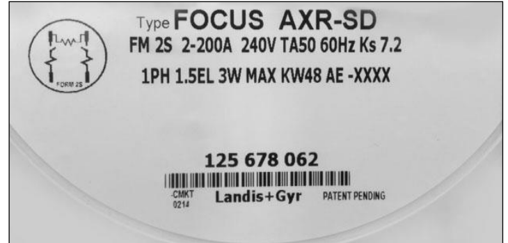
FOCUS AXR-SD Meter Nameplate / Plaque signalétique du compteur FOCUS AXR-SD